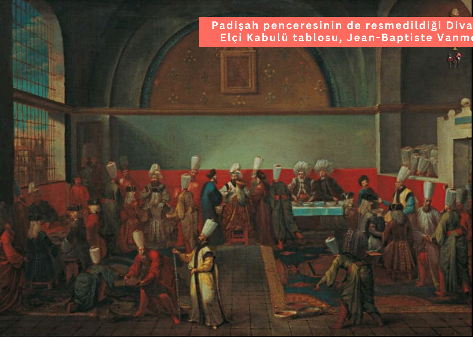
Padişah penceresinin de resmedildiği Divan'da Elçi Kabulü tablosu, Jean-Baptiste Vanmour

Adalet Kulesi padişahı simgeleyen; vezirler divan toplantısı yaparken padişahın istediği zaman gizlice gidip kasrın penceresine yerleştiği ve gölgesi ile toplantıları takip ettiği yerdir. Kulenin dışındaki pencereler son dönemde açılmıştır; asıl pencere Kasrı Adl olarak adlandırılan ve dışarıya değil içeriye açılan padişah penceresidir. Diziler her ne kadar Topkapı Sarayı'nın odağını Kanuni ile Hürrem'in balkonuna çevirmiş olsa da Topkapı Sarayı'nın, Osmanlı tarihinin ve hatta bir dönem Avrupa tarihinin en meşhur penceresi işte Divan-ı Hümayun'daki bu penceredir.