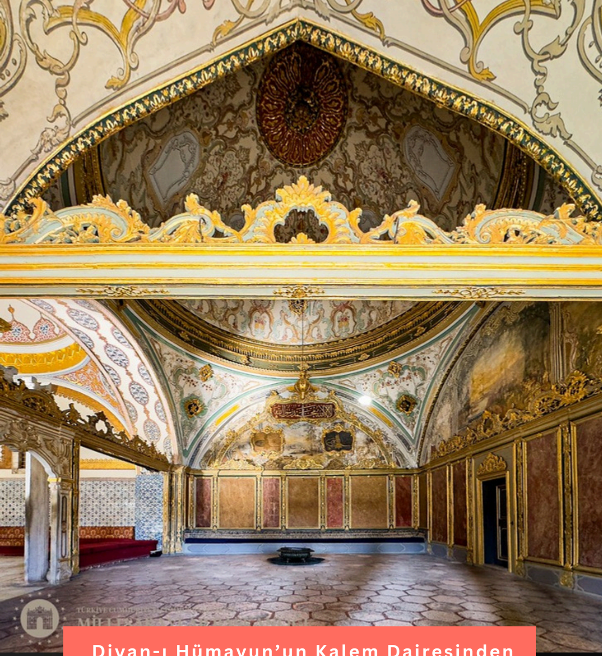
Divan-ı Hümayun'un Kalem Dairesinden

Divan'daki bu pencere kadar dikkat çeken bir başka mimari unsur da altın top ya da yaldızlı küre gibi isimlerle adlandırılan tob-ı müzehhebdir. Divan'ın kubbesinden sarkan altın kaplama bu delikli küre, yeryüzünü temsil eder. Kürenin asılı olduğu zincir aklın ipidir. Bu ipin ucu görünürde Sadrazam'ın elindedir ama aynı kürenin görünmez ipleri elbet padişah penceresine uzanır. Kararlara doğrudan dahil olmayan padişahın, Divan toplantıları sırasında hoşuna gitmeyen bir karar konuşulduğu vakit demir kafese vurduğu yahut perdesini çektiği anlatılır.