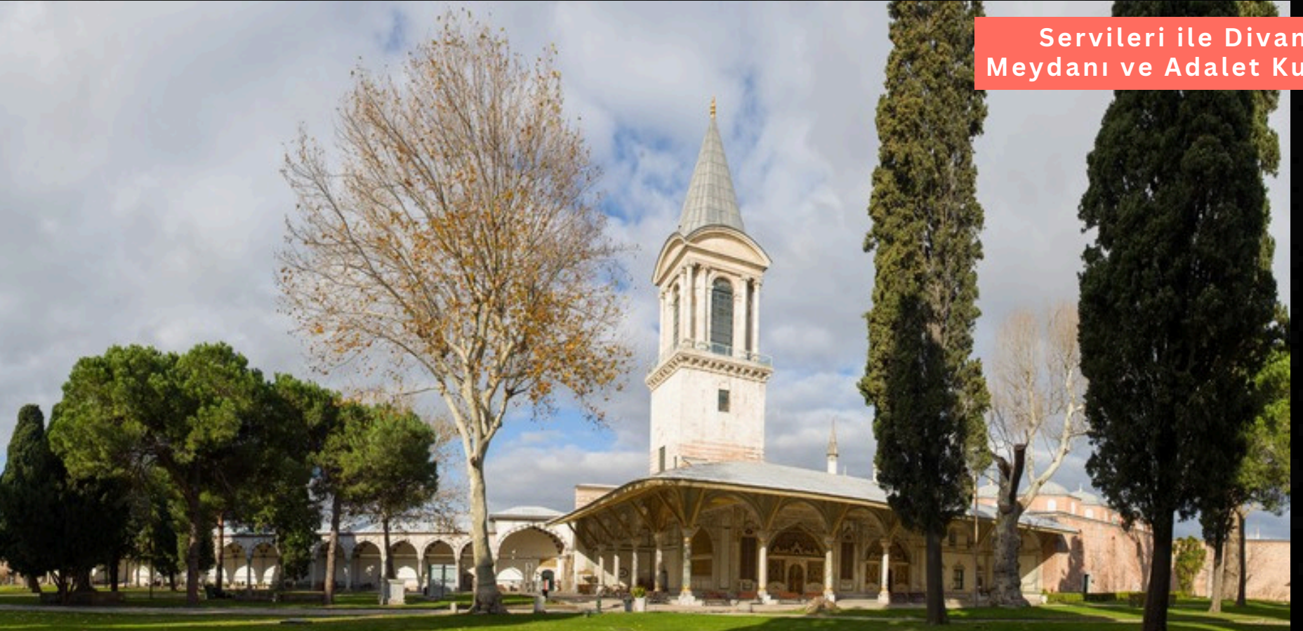
Servileri ile Divan Meydanı ve Adalet Kulesi

Babüselam'a yani Selam Kapısına dikkatlice bakın; kalem işleri, cephedeki küfeki taşından kesmeler, ayetler ile süslü bu kapı devletin gücünü sembolize eder. Dışarıdan kuleleri, içeriden renkleri ile gösterişli ve güçlüdür.