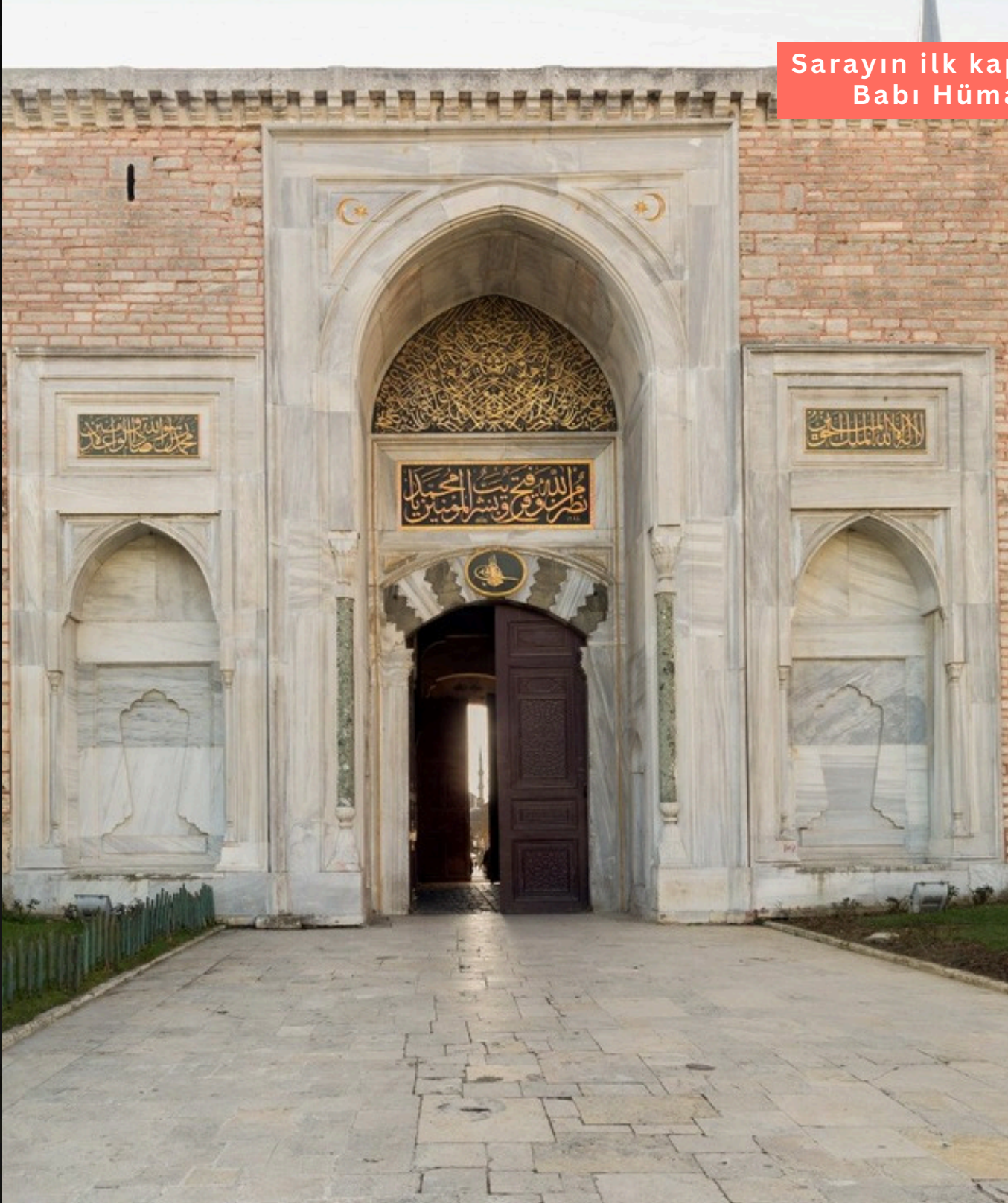
Sarayın ilk kapısı olan Babı Hümayun

Topkapı Sarayı ayrıca Türkiye Cumhuriyeti'nin ilk müzelerinden biridir. Cumhuriyet'in ilanından hemen sonra, daha tarihler 1924'ü gösteriyorken, Atatürk'ün ileri görüşlü emirlerinden biriyle "müze ittihaz olunmak üzere" boşaltılmış ve 1934'te kapılarını ziyaretçilere açmıştır. Bugün Türkiye'nin en çok ziyaret edilen müzesidir. Son yıllarda idaresi Kültür ve Turizm Bakanlığından Milli Saraylar İdaresi Başkanlığına geçen Topkapı Sarayı'nda pek çok yeni seksiyon ziyarete açılmıştır.