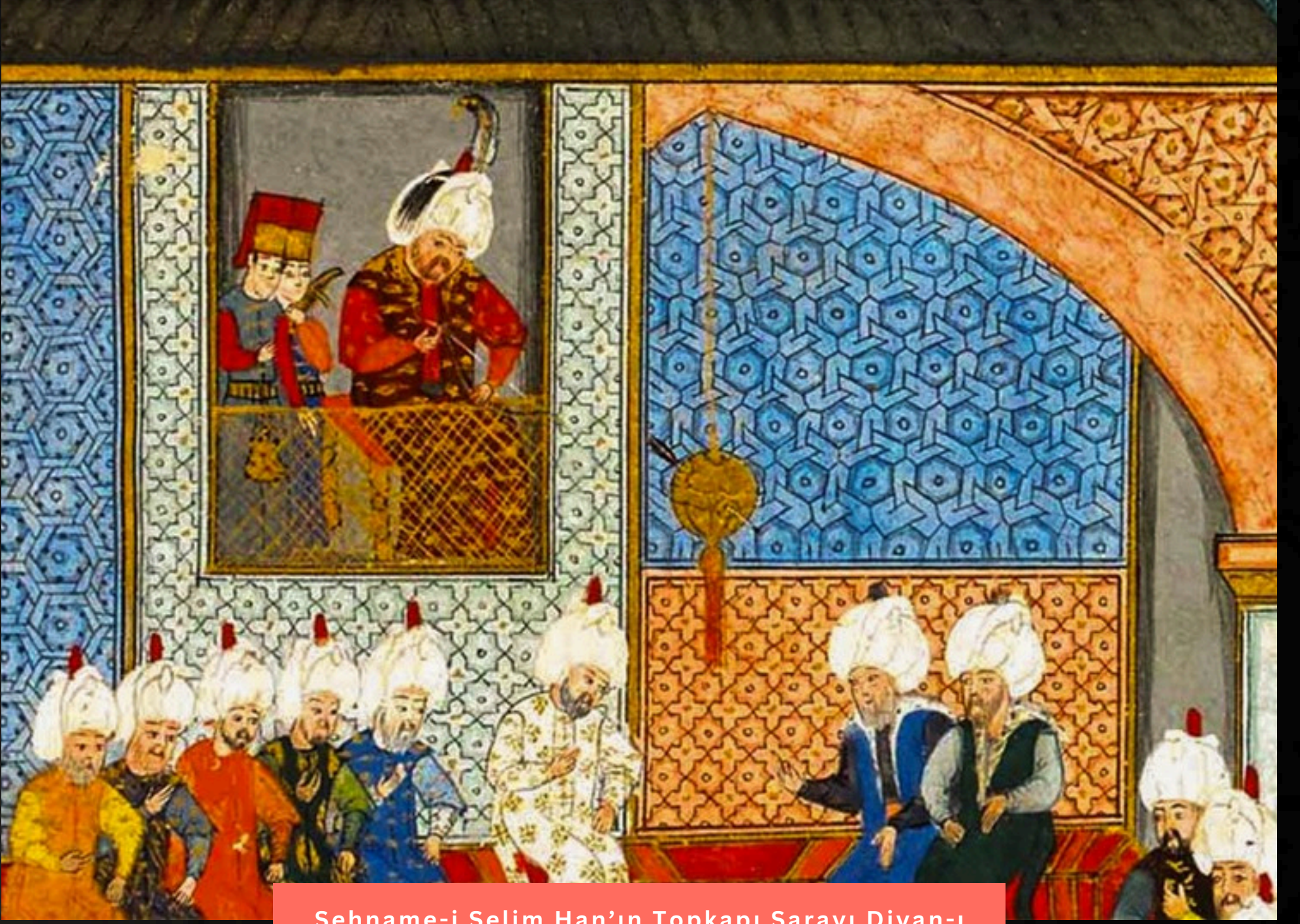
Şehname-i Selim Han'ın Topkapı Sarayı Divan-ı Hümayunu minyatüründe pencereden bakan padişah ve altın küre de görülebiliyor.

Adalet üzerine bu kadar konuşmuş, düşünmüş, mimari biçimler geliştirmiş bir Osmanlı'dan bugüne nasıl geldik, bunu düşünmek için en uygun yer belki de Divan'a bitişik durumda inşa edilmiş Dış Hazine binasıdır. Burası bugün sarayın en ilgi çeken koleksiyonlarından biri olarak silahların yer aldığı kısımdır. Eserlere kendinizi çok kaptırmadan hızlıca bakmalısınız çünkü sarayın bu en prestijli avlusundan en gündelik yaşamına şahit olmak üzere Mutfaklara gideceğiz.