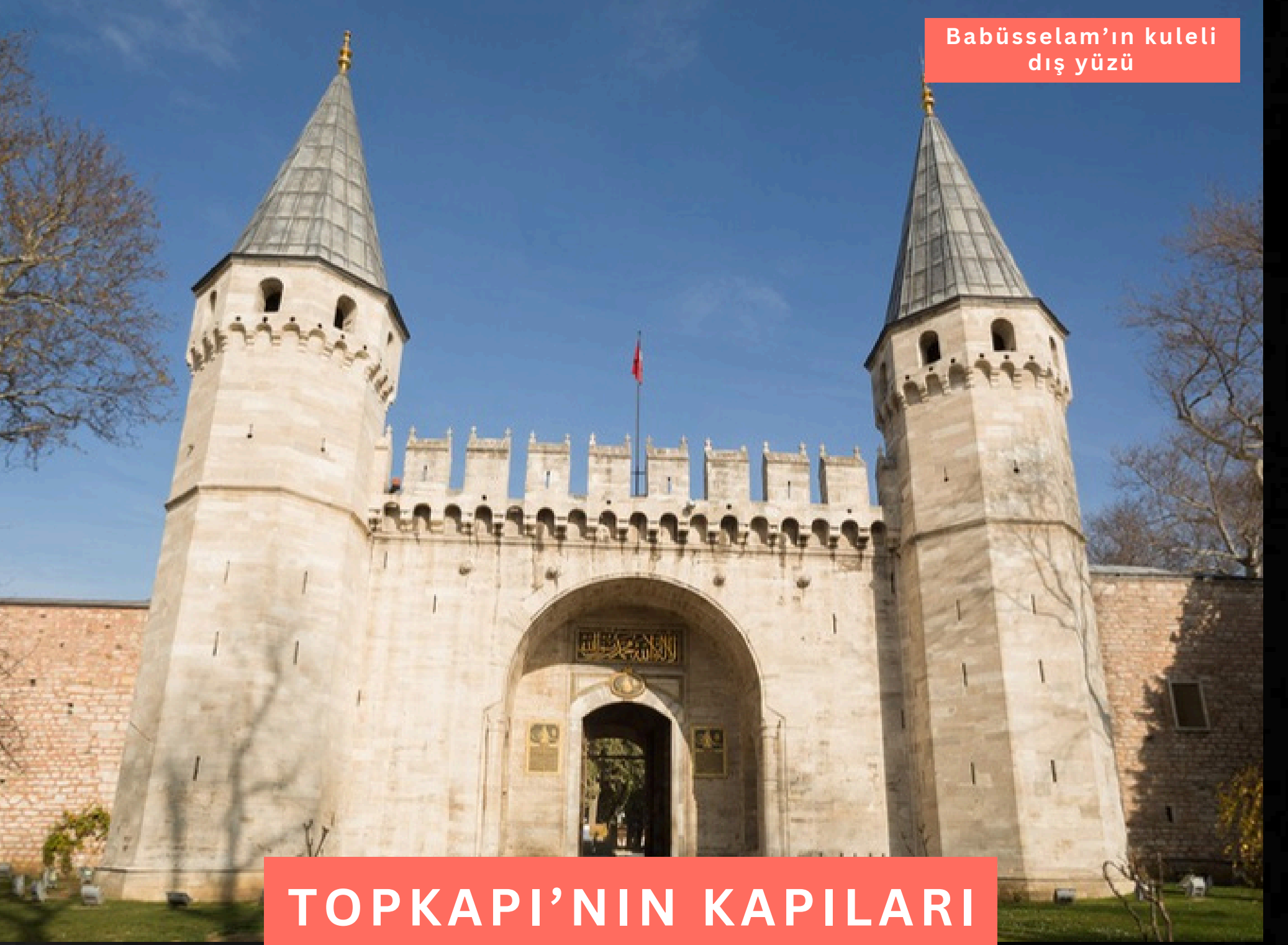
Babüsselam'ın kuleli dış yüzü